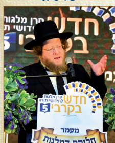
הגאון רבי שלום בער סורוצקין שליט"א