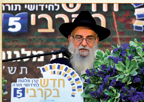
הגאון רבי מרדכי יצהרי שליט"א נשיא הארגון

השגחה פרטית מיוחדת ניכרה לאחר מעשה, כאשר רבים תמחו על הקדמת הכנס לליל תענית אסתר, מספר שבועות לפני מועד קיומו בכל שנה. אמנם, שלושה ימים לאחר קיום המעמד האדיר כבר החלו ההגבלות על קיום כינוסים ציבוריים לשם שמירת הבריאות, ומאת ד' היתה זאת שמעמד 'חדש בקרבי' היה מן המעמדים הציבוריים האחרונים שבהם היו יכולים להתכנס אלפי אנשים יחדיו לכבודה של תורה. ובחסד ד' - איש מן המשתתפים במעמד הכביר לא התגלה כחולה, ולא נצרך להיכנס לבידוד וכיוצא בזה. יצוין עוד כי בשל המצב בחודשים האחרונים נדפס גיליון חודש ניסן בפורמט מצומצם, ומשום כך מתפרסם בזאת שוב הסיקור הנרחב על המעמד הגדול. זמן רב קודם פתיחת השערים כבר צבאו ההמונים על פתחי האולם, משכן האירועים 'קונקורד' היוקרתיים בבני ברק, שנשכרו במיוחד בכדי להכיל את המוני המשתתפים, מרנן ורבנן גדולי התורה ראשי הישיבות ומורי ההוראה, לצד תלמידי