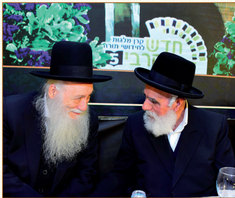
הגאונים רבי שלמה מחפוד ורבי אליעזר כהנמן שליט"א