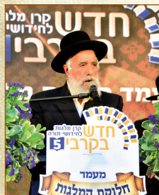
הגאון רבי שלמה מחפוד שליט"א