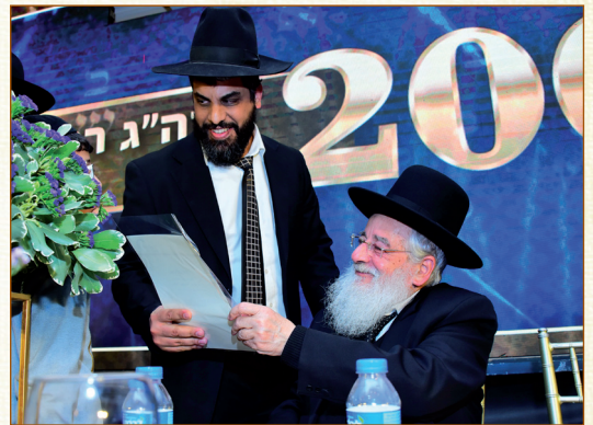
הגאון רבי פנחס קורח בחלוקת מלגות