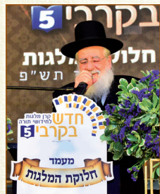
הגאון רבי פנחס קורח שליט"א