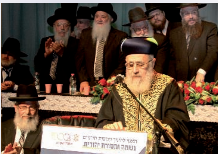
עם הראש"ל הגר"ע יוסף ורבני פתח תקוה שליט"א

זכה רבי ישראל שהותיר אחריו דור ישרים מבורך. בנו וחתנו, נכדיו וכל צאצאיו אשר הולכים בדרך התורה וממשיכים את מורשתו הטהורה, לקרב את הרחוקים ולהגדיל תורה ולהאדירה.