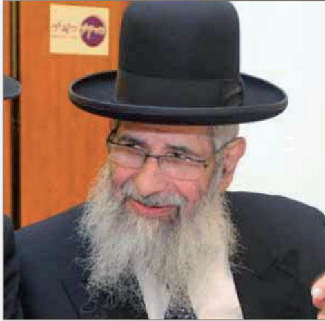
רבי ישראל שרעבי זצ"ל