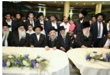
בשמחת בית השואבה