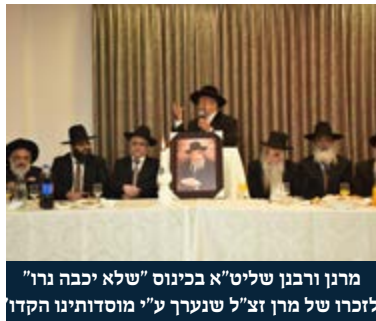
מרנן ורבנן שליט"א בכינוס "שלא יכבה נר" לזכרו של מרן זצ"ל שנערך ע"י מוסדותינו הקדור

דרכי חשיבתו והלך רוחו היו באופן אישי ומקורי שהפליאו גדולים וטובים. הוא התרחק מליקוטים, וכל מלה בספריו חצובה מהגייוני לבו. בדרך בדיחותא היה נוהג לומר, כי אילו חיבר ספרים על ידי ליקוט - היה מוציא לאור ספר בכל חודש.