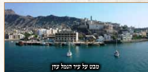
מבט על עיר הנמל עדן