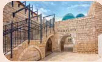
ציון רבי שמעון בר יוחאי במירון

מְנַהֵג חָבִיב וּמְפָרֵס מְבִינֵה בְּיוֹתֵר הוּא לַעֲרֵף מְדוּרוֹת. אֶת הַמְּדוּרוֹת מְדַלְקִים כְּזֵכֶר לְאוֹר שֶׁגִּלָּה רַבִּי שֶׁמְעוֹן בְּמֶשֶׁךְ חָיוּ, וּבְמִתְחַד בְּיוֹם פְּטִירָתוֹ - ל"ג בְּעֶמֶר. כְּמוֹ כֵּן, הַמְּדוּרָה מְרַמְזֶת עַל הָאֵשׁ שֶׁהִיָּתָה סְבִיב בֵּיתוֹ שֵׁל רַבִּי שֶׁמְעוֹן בְּעַת שֶׁגִּלָּה אֶת סוּדוֹת הַתּוֹרָה לְתַלְמִידָיו. מְנַהֵג נוֹסֵף הוּא לְצַאֵת אֶל הַשְּׂדוֹת וְלִשְׁחַק בְּחָץ