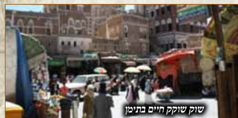
שוק שוקק חיים בתימן