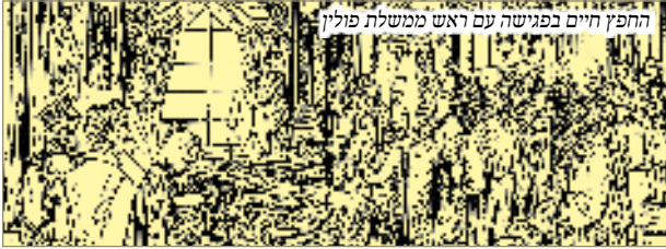
החפץ חיים בפגישה עם ראש ממשלת פולין

אם אתם תנסו בפנטומימה ושבירי מילים באנגלית, או אפילו תלמדו את שפתם, ספק אם תצליחו. אתם פשוט לא משדרים על אותו תדר! פערים מנטליים עצומים יש ביניכם, וגם בסימני הידיים ותנועות הגוף יש שינויים. למשל, יש מקומות שאם אתה מרים אגודל פירושו 'כל הכבוד', ובמקום אחר נחשב הדבר כתנועת בוז. ברם, דבר אחד אינו נעצר מבעד למחסומי המנטליות והשפה. האופן היחידי בו אפשר להבין זה את זה, הוא הבעות הפנים והרגשות המתפרצים מהן , שהם כלי אדיר לתקשורת בין גופים, והם חובקים עמים ויבשות, כמין שפה בין לאומית.