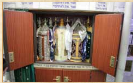
ההיכל שבו שוכן הספר המקודש

כשהפולשים המבועתים חזרו מפוחדים לעיירה וסיפרו על נפלאותיו של ספר התורה